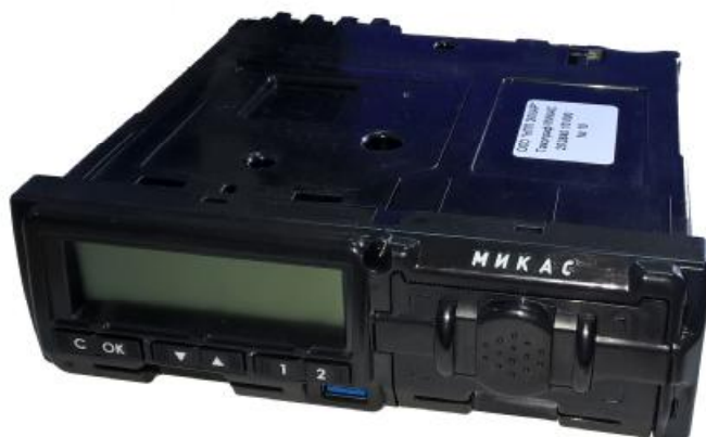
Рисунок 1 – Общий вид тахографа

Внешний вид тахографов приведен на рисунках 1, 2. На рисунке 2 приведены схема пломбировки тахографов от несанкционированного доступа и место нанесения знака утверждения типа.